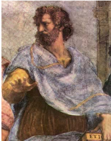
Aristotele nell'affresco di Raffaello della Scuola di Atene

MEDIASHOW 2007 Melfi 30 marzo - 1 aprile